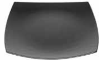
bord Ninja vierkant zwart 16 cm