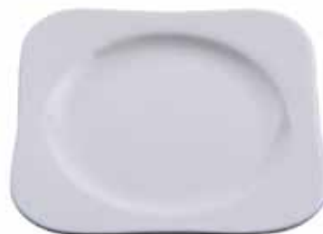
broodbord Papillon 11 cm